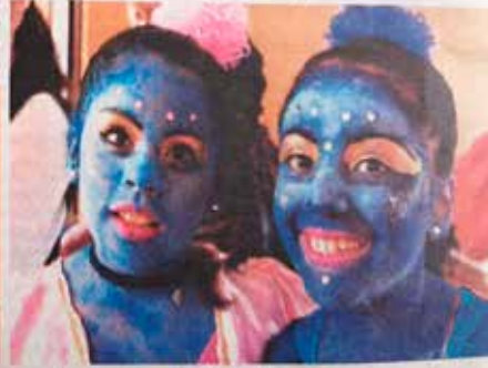
Diversas alternativas ofrece el taller de Teatro en el Centro Comunitario El Palomar.