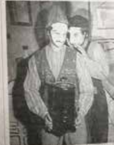
El uso de este particular estilo de mostrar ayuda a desarrollar los personajes.