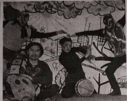
EL MONTAJE PRÓXIMO A ESTRENAR ES UN PROYECTO FONDART.