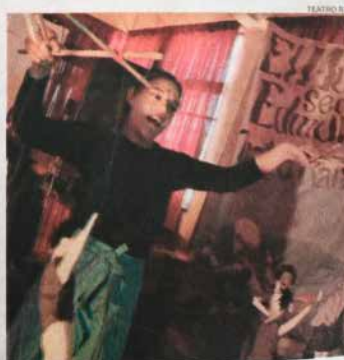
LOS TITERS SE ROBARAN LAS MIRADAS.