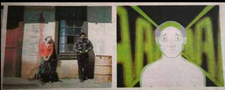
QUINTO FESTIVAL IBEROAMERICANO DE CINE Y VIDEO DE CALDERA ATACAMA 2005