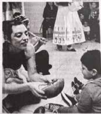
LA IDEA ES REALIZAR UNA ESCUELA TEATRAL PERMANENTE.

interesados en ver esta obra también pueden contactar a la compañía a través de su cuenta de Facebook.