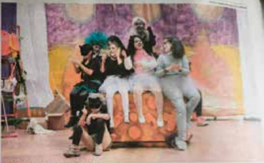
TALES FUE LA OBRA QUE PRESENTÓ EL GRUPO ANIMEL.

ESPECTÁCULO. En el Centro Comunitario El Palomar se realizó el cierre de año de la Academia de Teatro Municipal "Una Vida, Mil Historias".