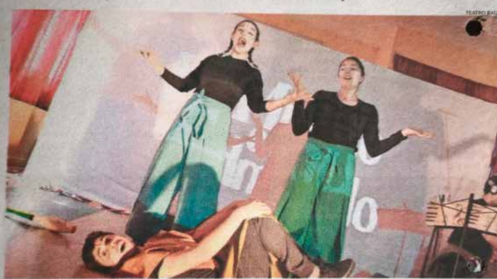
“EL MUNDO DE EDMUNDO” ENFRENTA A UN NIÑO A LA TECNOLOGÍA, HACIENDO QUE DESCUBRA SUS SUEÑOS.

CULTURA. La presentación de la obra de la compañía local “Teatro Raíz” comenzará sus funciones gratuitas el sábado en el Parque Schneider.